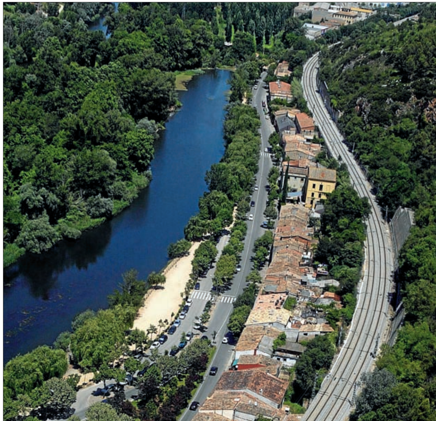
La planificación del territorio abarca zonas de Catalunya como las que muestran estas fotografías.

→ Ley de urbanismo. Tiene como preocupación esencial la protección del espacio abierto, es decir, el suelo no urbanizable, y las condiciones de producción de la nueva ciudad . Para ello, promueve los desarrollos urbanos lo más compactos y cohesionados posibles, establece nuevas medidas de protección del suelo no urbanizable. Además dispone que una parte sustancial de la nueva vivienda que se proyecte deberá ser de protección oficial.