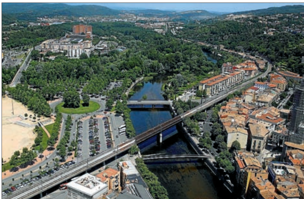
Trazado del AVE entre Barcelona y La Jonquera a la altura de Girona.

-En el campo del planeamiento territorial y urbanístico desde siempre han tra-