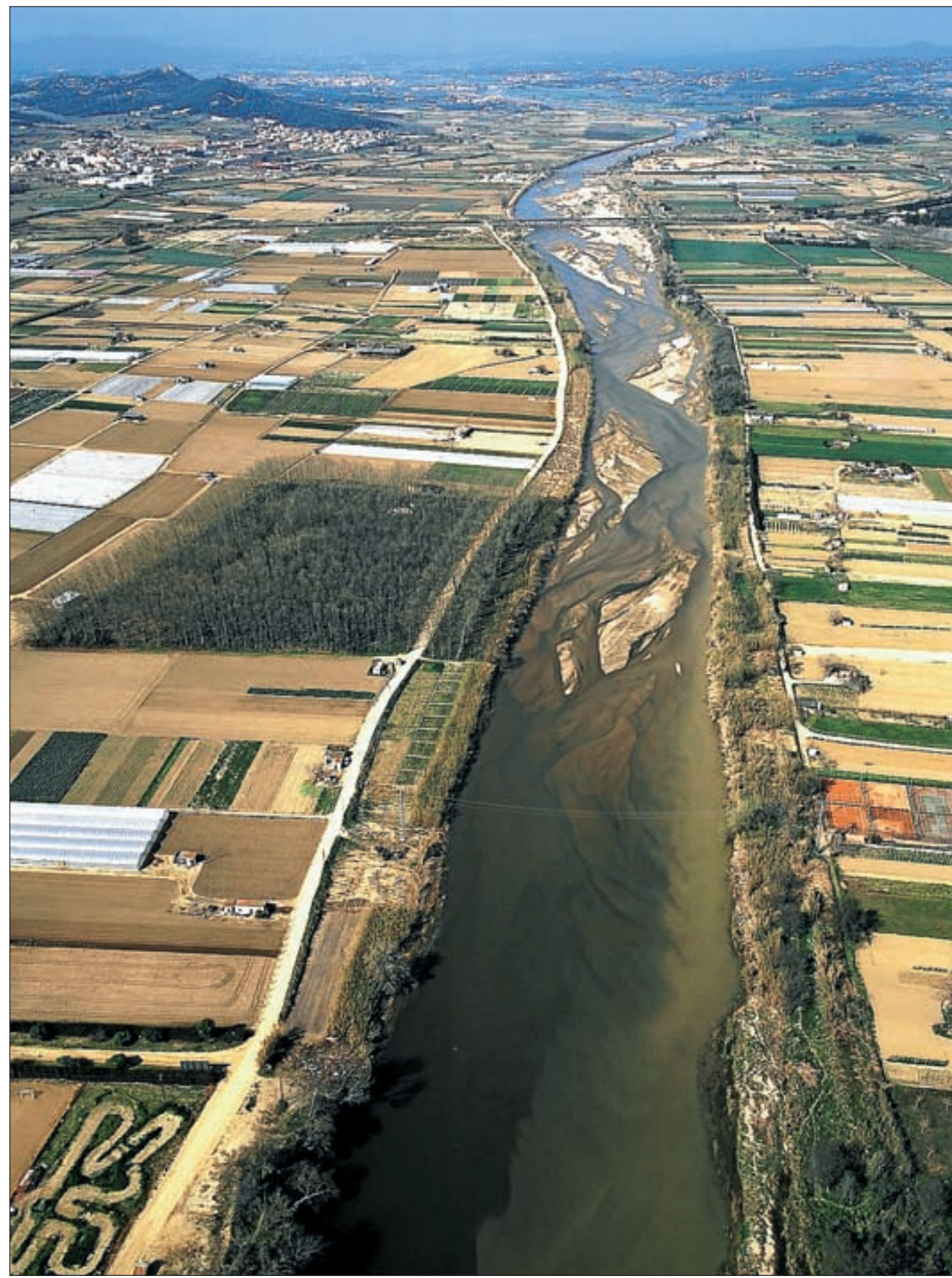
Imágenes aéreas de varias áreas residenciales estratégicas (ARE) del territorio catalán captadas desde un helicóptero.

→ Equipamientos y servicios. Se prevé una dotación suficiente de suelo destinado a zonas verdes y equipamientos, así como la prestación idónea de los servicios necesarios para la población que vi-