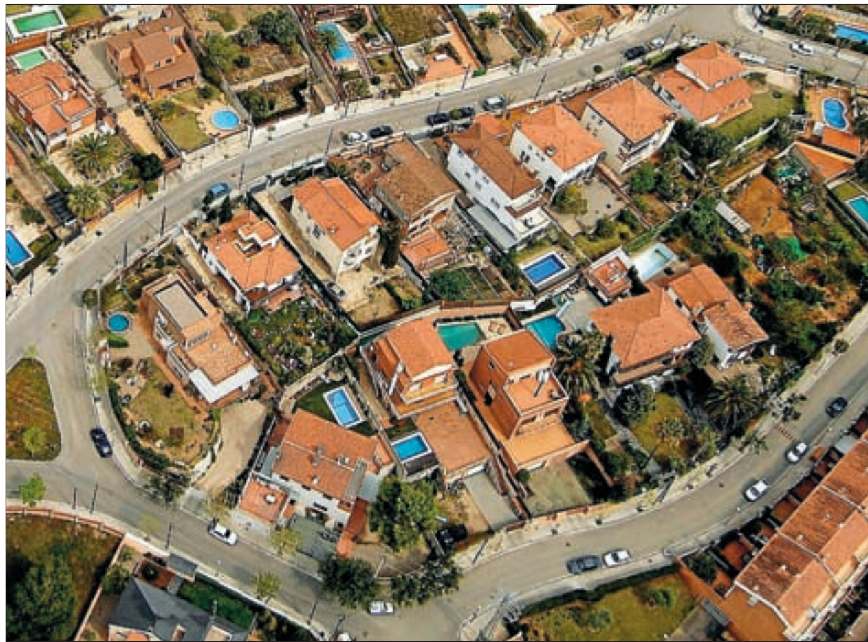
Vista aérea de una urbanización situada en el área metropolitana de Barcelona.

Creemos que se han conseguido unos documentos con el tono adecuado, abiertos pero también normativos, que definen un modelo territorial básico que debe orientar la planificación urbanística municipal y los proyectos y planes sectoriales, los cuales, desde sus ópticas, deben contribuir a concretarlo y enriquecerlo. ☉