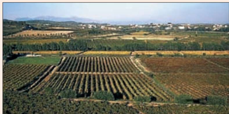
Campos de viñas en la comarca del Penedès.

Gobernar un país pasa siempre por realizar actuaciones sobre su territorio, decidir la ubicación de obras públicas, equipamientos, etcétera. Sin política territorial, o no hay política, o bien no hay país. Gracias a la autonomía, la ordenación del territorio se inicia en el año 1983, pero no es hasta 1995 que se aprueba el plan general, y de los parciales, en el 2004 solo existía uno acabado y aprobado. Entonces se reactiva la planificación, no solo de los ámbitos de los planes parciales territoriales, sino también con la aprobación de diferentes planes directores territoriales y urbanísticos, entre los que destaca el plan del sistema cos-