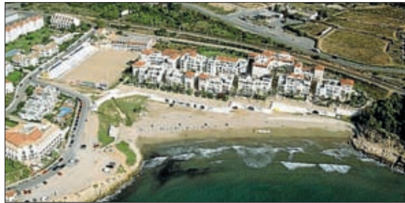
Vista aérea de una urbanización en primera línea de mar.

Debemos utilizar eficientemente el espacio de nuestro país, disponiendo los crecimientos urbanos y las infraestructuras para construir un modelo territorial más vertebrado funcionalmente, más cohesionado socialmente y más sostenible. Se deben superar las visiones fragmentadas por términos municipales, los objetivos simplemente sectoriales y la limitada perspectiva de los problemas más inmediatos. Catalunya se dotó mediante la ley de política territorial de 1983 de instrumentos para proyectar el futuro de su territorio desde una visión amplia y comprensiva: los planes territoriales. Hay que añadir, aun así, que por el mero hecho de no ser imprescindibles –los planes urbanísticos y los proyectos de infraestructuras permiten resolver cual-